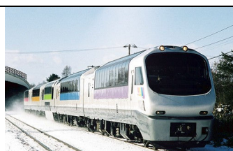
TOMAMU SAHORO 滑雪特急列车