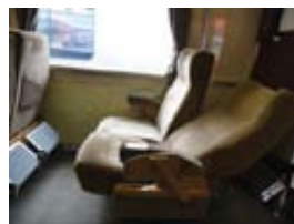
对号座 (Dream Car)