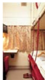
Twin Deluxe (双人房)