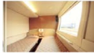
Cassiopeia Suite (双层客室)