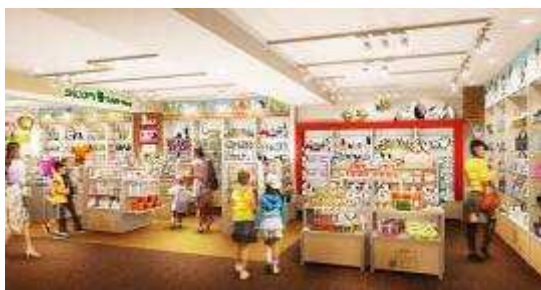
“SNOOPY Town Shop 原宿店” (店内示意图)

在地下1楼登场的是专卖店“SNOOPY Town Shop 原宿店”。以“Happiness is . . . a warm puppy（幸福源于 . . . 温暖的小狗狗）”为主题，由极受欢迎可爱的SNOOPY 及其小伙伴们齐聚一堂的“PEANUTS”官方卖场。本店以“PEANUTS 中伙伴们的居住城市”为创意，表现了在蓝色天空下弥漫着绿色的城市里，PEANUTS 的伙伴们在学习和玩耍中有哭有笑，有从漫画世界中一跃而出、充满幽默感的世界大观。