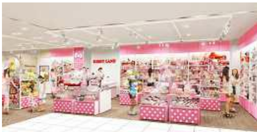
“凯蒂猫专卖店原宿店” (店内示意图)

由 KIDDY LAND 精心挑选并提案的为全世界所喜爱的凯蒂猫、My Melody及Little Twin Stars等SANRIO 人气造型商品商店。店内色调为粉红色，以仿似凯蒂猫房间的店内装修来表现娇美可爱的梦幻空间。迎合外国观光客需求的以“和”为主题的货品也不少，处处向世界散发出“日本可爱文化”之气息。