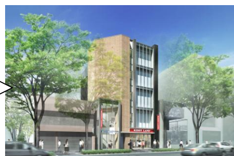
2012年7月 全面开业 (示意图)