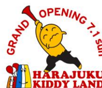
KIDDY LAND 原宿店 全面开业标志