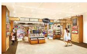
“迪士尼专柜”（暂定名） （店内示意图）

以再现美国美好复古之气氛而设计的“迪斯尼”专卖场。米奇、米妮、小熊维尼、史迪奇等超人气造型商品当然榜上有名；此外还有开业纪念限量产品。店内各处亦可作为摄影点，尽享其乐趣。