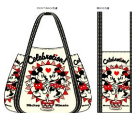
原宿店开业纪念商品例（示意图）