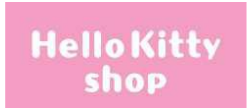
“凯蒂猫专卖店原宿店” 标志