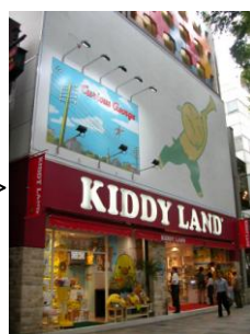
2005 年 8 月