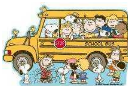
原宿店开幕纪念产品之一(示意图) “鼠标垫”840日圆(包税) © 2012 Peanuts Worldwide LLC