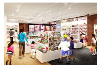
3 楼 柜台景观

专卖店“PrismStone”和“Collection Doll”等。除经营颇受女孩青睐的玩具、“多美卡”、“普乐路路”及男孩为之神往的“LEGO”积木、英雄和战队系列动作玩具等之外，还备有拼装造型及塑料模型等适合成人玩趣之玩具。