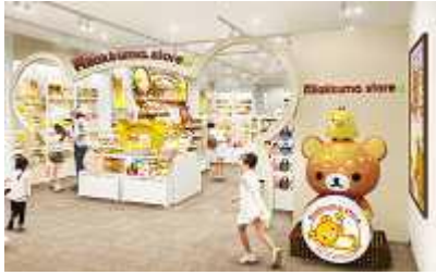
“Rilakkuma store 原宿店” (店内示意图)

以“Happy life with Rilakkuma (与轻松小熊一道幸福生活)”为创意的轻松小熊专卖店。其造型可爱，在店内随处可见。对于沉浸在轻松小熊世界中的顾客而言，本店亦不失为可安愈您心灵的一个所在。原宿店的货品齐全，亦备有少量商品等以供挑选。