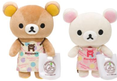
原宿店开店纪念商品例(示意图) “珍藏毛公仔(棕色轻松小熊/Korilakkuma)” 各1,365日圆(包税)