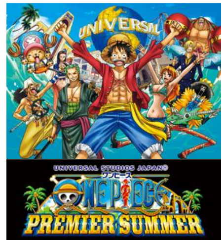
©尾田栄一郎／集英社・フジテレビ・東映アニメーション © & ® Universal Studios.

今年的“海贼王特级之夏”，从表演、主题餐厅以致特色商品等，都是围绕着“新世界篇”的故事情节而展开，粉丝们绝对不容错过。以追求究极质量的精神，我们为您呈现进入“新世界篇”后的重磅升级人气角色及海贼王世界，请您亲临体验种类繁多的娱乐设施。*观看特级表演的观众，除影城门票外，还需购买专用的表演门票。