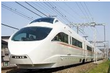
连接新宿与箱根的“浪漫”特快