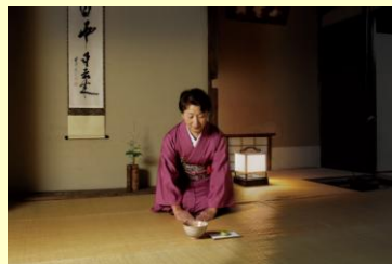
箱根强罗公园内的白云洞茶苑