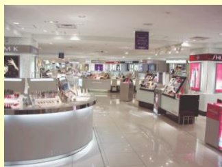
小田急百货公司新宿店