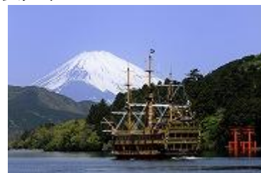
芦之湖的箱根海贼观光船与富士山