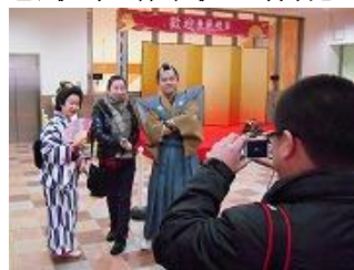
与武士和侍女一起合影留念