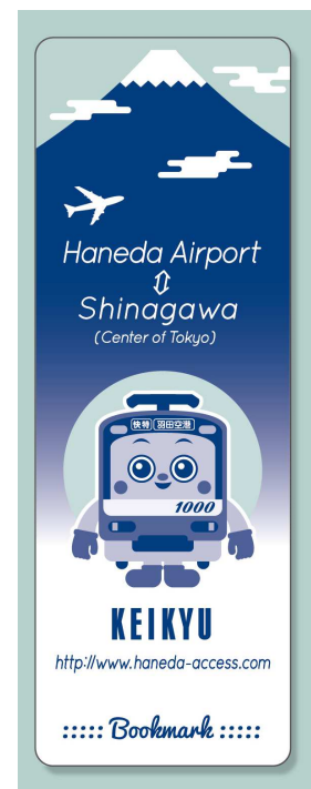
赠品的京急特制书签