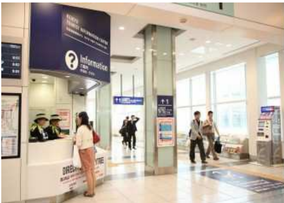
羽田机场国际线航站楼站 京急旅游咨询中心