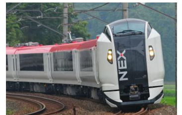
N'EX 东京往返车票有效范围