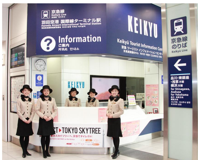
羽田机场国际线航站楼站 京急旅游咨询中心（京急TIC）

※京急线站内的7-ELEVEN店铺内等设有Seven银行ATM，京急电铁与Seven银行共同为促进访日外国人的集散及利用而一直进行各类合作。