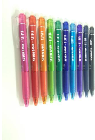
Seven 银行和京急特制 可擦水笔（样品）

活动期间内，向在京急旅游咨询中心购买“WELCOME! Tokyo Subway Ticket”的访日外国游客赠送 Seven 银行和京急特制的可擦水笔。