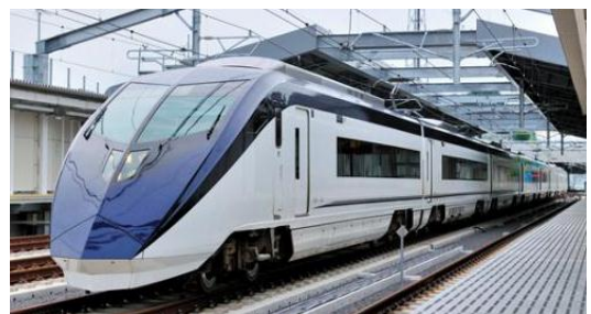
列车内可以使用免费Wi-Fi

本公司提供Wire and Wireless Co.,Ltd.的服务项目，因此用户不仅在Skyliner列车内，而且在全国24万个左右的访问热点也可以利用Wi-Fi服务。