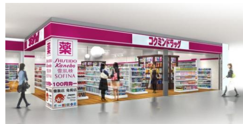
免税专柜・新开业店铺（效果图）