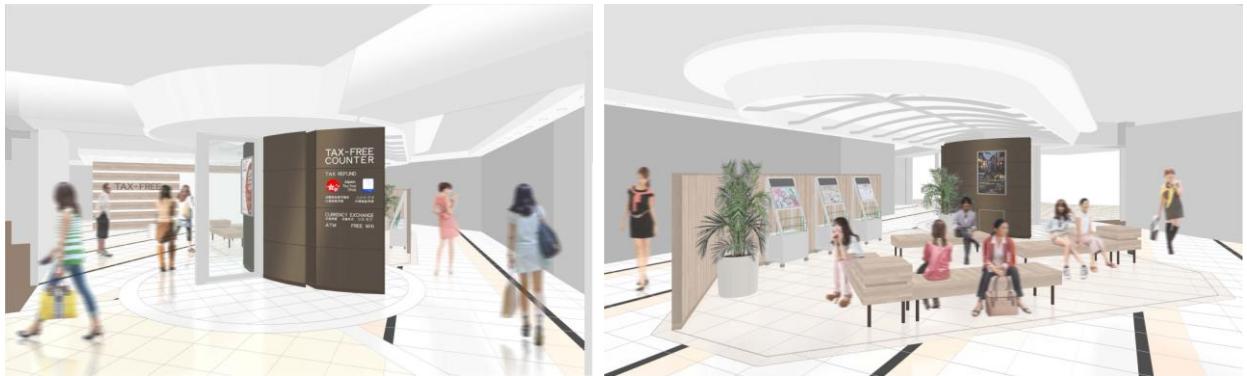
新设的免税专柜 (效果图)