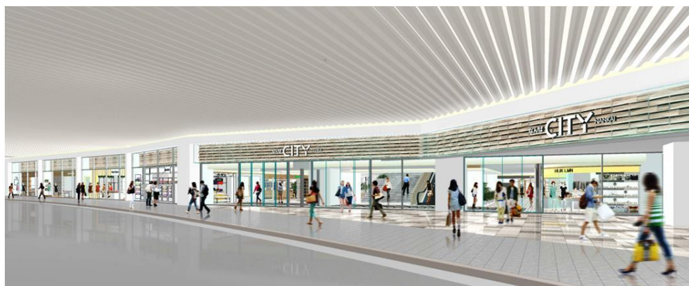
改装后的南馆入口（效果图）