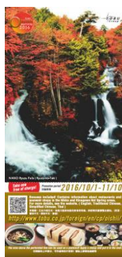
△活动明信片(参考图片)