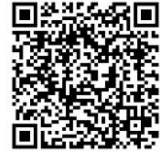
△二维码(活动网站首页)

首页 http://www.tobu.co.jp/foreign/en/cp/oishii (英语、简体字、繁体字、泰文)