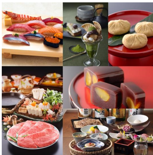
△介绍菜单（参考图片）