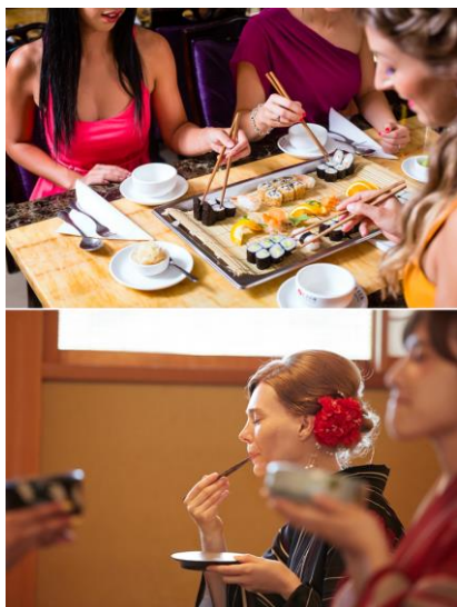
△体验饮食文化（参考图片）