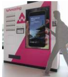
免费SIM卡领卡机 (示意图)