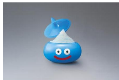
史莱姆刨冰~夏德攻击结冰了?! 苏打口味~