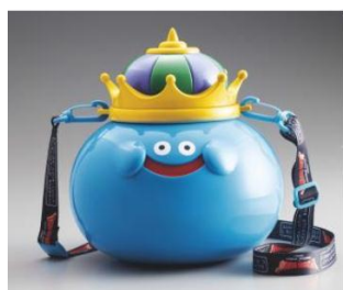
国王史莱姆爆米花桶

另外也将贩售『史莱姆刨冰~夏德攻击结冰了?! 苏打口味』，被夏德（冰系咒文）攻击而结冰了?! 史莱姆变成刨冰。不光只是游乐设施，就连美食也要让你尽享「勇者斗恶龙」的世界。