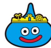
日本环球影城独创 史莱姆