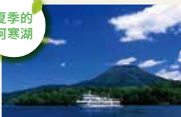
米其林日本绿色指南的改订版中, 被评为三星的阿寒湖