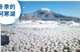
在严冬的阿寒湖绽放的纯白花朵 “霜花”