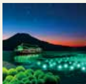
夏季风物诗 “阿寒湖绿球藻夏希灯”