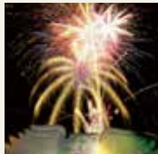
冬季风物诗 “阿寒湖冰上嘉年华”