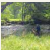
清流嬉戏。 阿寒川探索“溯溪”