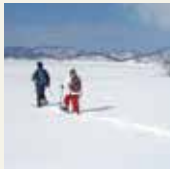
一起享受雪中森林及河川。 “雪靴”