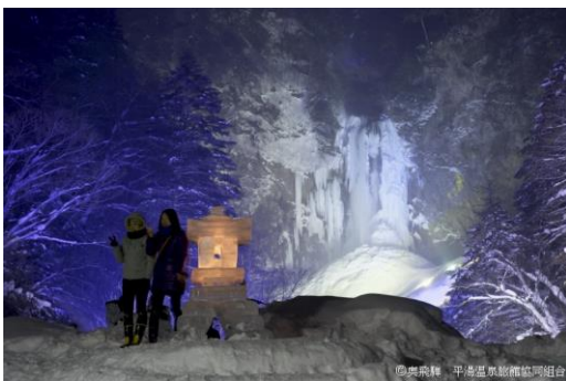
岐阜県観光局 平湯温泉観光協会提供

URL http://www.hirayuonsen.or.jp/evnet01.htm