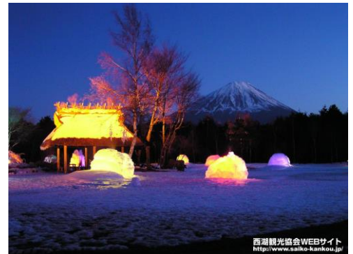
西湖観光協会WEBサイト http://www.saiho-kankou.jp

URL http://www.fujisan.ne.jp/event/info.php?ca_id=3&if_id=553