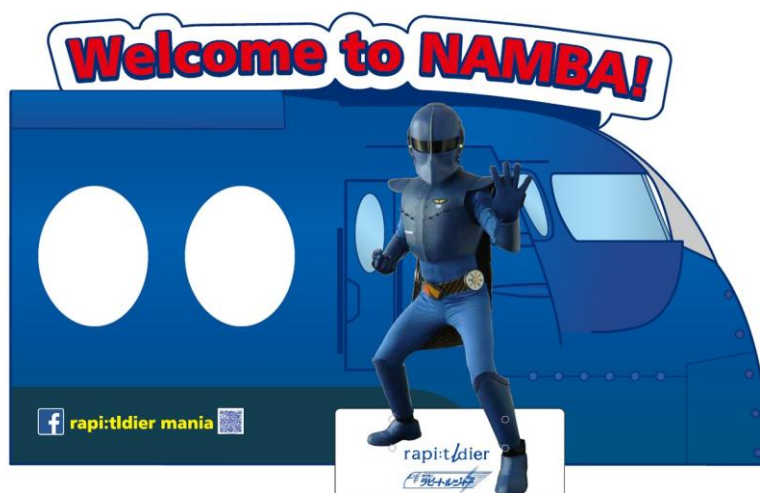
等身人像（左） 留影板（皆为参考图）