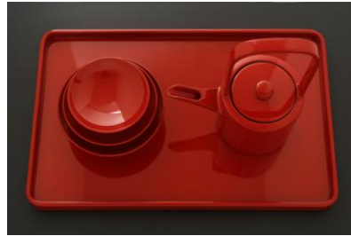
輪島塗しおやす漆器工房 塩安康平 五件酒器組 朱呂色獨樂沈金