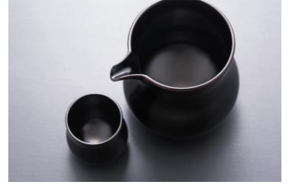
榊蔦屋漆器店 大工治彦 酒杯 鶯 片口 鼻