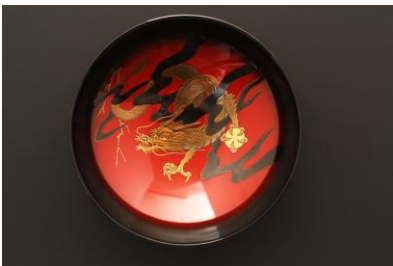
前野漆工房 前野勤 盃 龍(高蒔繪)