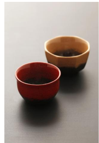
山崖松花堂 山崖大祐 脱干漆酒杯 不二山 脱干漆酒杯 赤富士