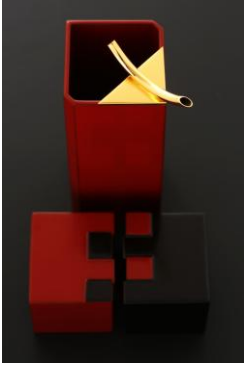
千舟堂 岡垣祐吾 七勺升、注器「月」