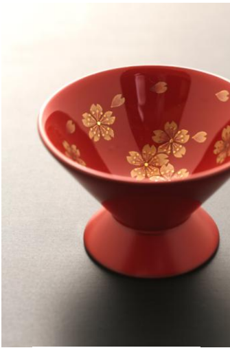
坂口漆器店 坂口彰緒 兩用盃 櫻・富士