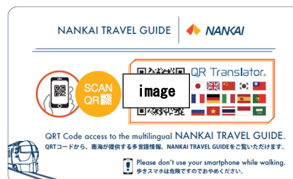
刊登有 QR 二维码的卡片