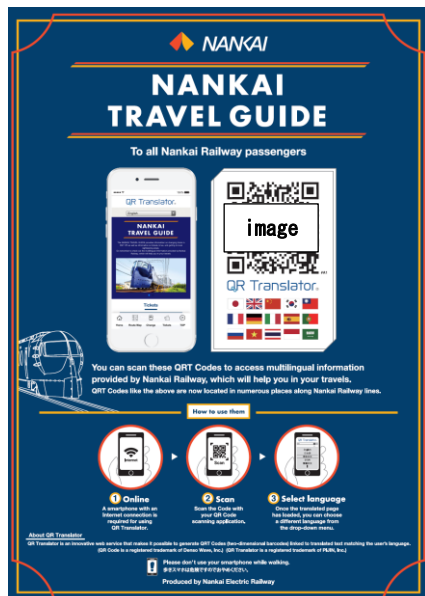
刊登有 QR 二维码的海报