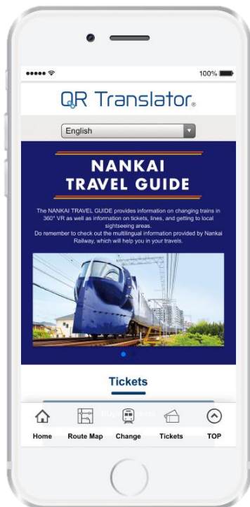
「NANKAI TRAVEL GUIDE」 手机画面效果图（英文界面）