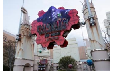
※图片为前次举办时的场景。